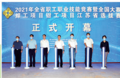
与会领导共同点亮开幕式灯柱

作为大赛的承办方,在徐工集团工会的指导下,学院成立竞赛联合工作组,全力以赴筹备竞赛各项工作,在设备调试、场地布置、氛围营造、后勤保障、疫情防控、竞赛流程等方面精心设计、缜密部署,为大赛顺利进行提供坚实保障。