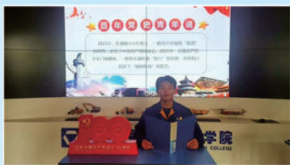
优秀团员接力百年党史青年说