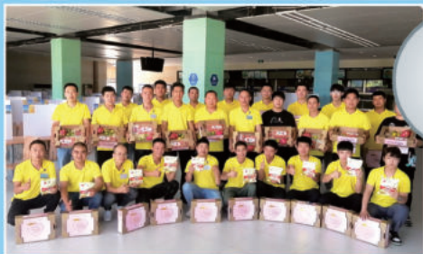
给学员送上礼盒,传递真挚祝福与浓浓关爱

下一步,学院将与徐工基础公司在基础工程建设等方面继续深入合作,共同推进工程机械专业化施工人才培养,凭借徐工科学高效的管理体系和质量意识,为经销商、代理商、客户企业培养输送门类齐全,结构合理的操作机手队伍,助力行业持续、健康、快速发展,为基础工程事业贡献徐工力量。