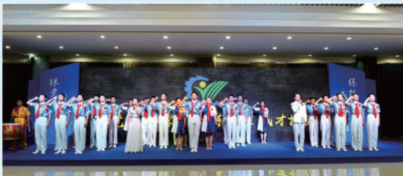
学院学生表演的《少年中国说》充分展现青年技能学子昂扬向上的精神风貌,充满蓬勃奋发正能量,博得满堂喝彩。

开幕式结束后,与会领导还视察了理论及实操考场,并参观学院国际实训中心,深入了解学院教育教学、学生培养等情况。