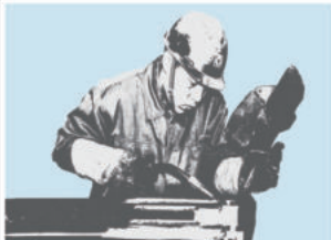
百名优生 闪耀 徐工