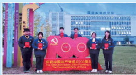
红色家书诵读获奖同学合影