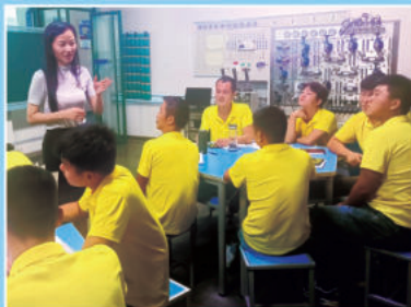
培训服务礼仪,提升机手服务能力和素养