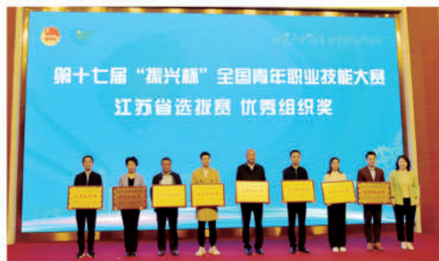
学院获颁最佳组织奖

名强手，两位小将沉着应战、稳定发挥，一举夺冠。本次比赛共产生 6 名冠军，我院独占 2 席，位列全省职业院校冠军榜第一，充分彰显学院在培养高技能人才方面的雄厚实力！