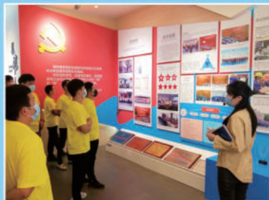
参观徐工文化展厅,感受优秀徐工企业文化