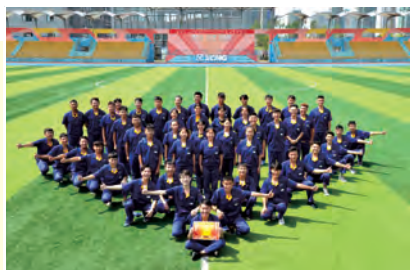
优秀班级:18机电控制班

学院对2018~2019学年学生群体涌现出的3个优秀班级、8个优秀宿舍、14个优秀团队、49名优秀学生干部进行表彰,激励他们在新的征程中砥砺前行,再创佳绩。