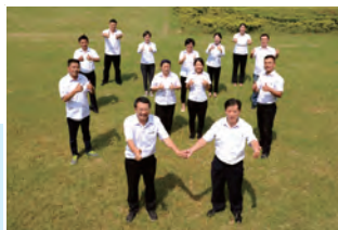
优秀部室:后勤保障部