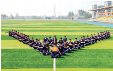
优秀班级:18智能制造2班