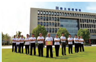
优秀教研室:工程机械装配与调试技术教研室