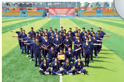
优秀班级:18焊接机器人1班